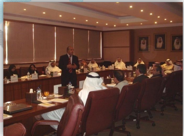
التميز المؤسسي ومنطق رادار Organizational Excellence & RADAR Logic