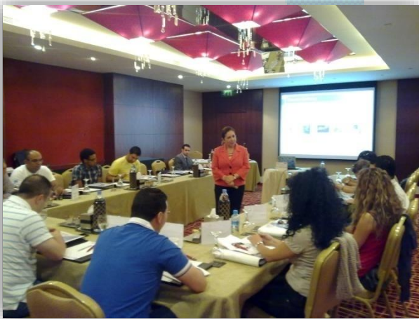
مهارات البيع الاحترافي Professional Selling Skills