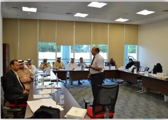
تدريب المدربين Training the Trainers