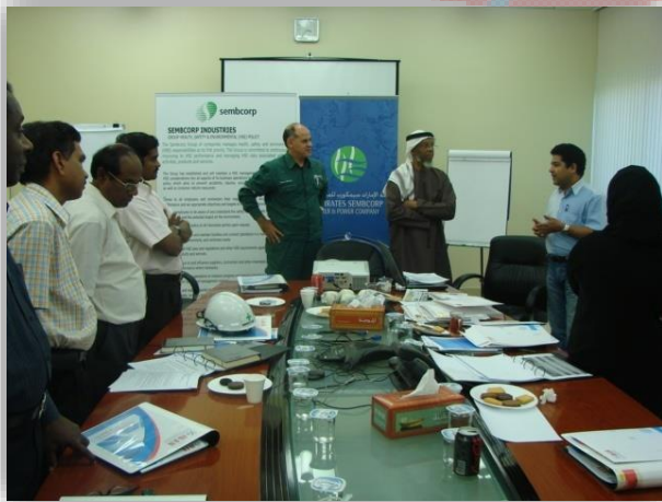
القيادة بالنتائج Leadership for Results