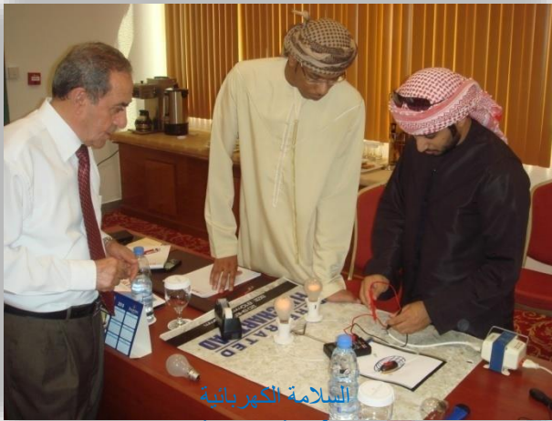
السلامة الكهربائية Electrical Safety