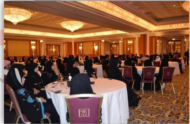
المهارات الإدارية الأساسية Basic Management Skills