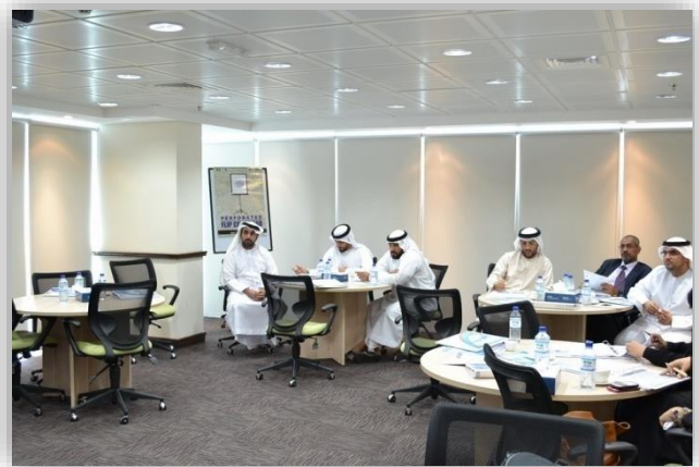
العمل بروح الفريق Team Work Spirit